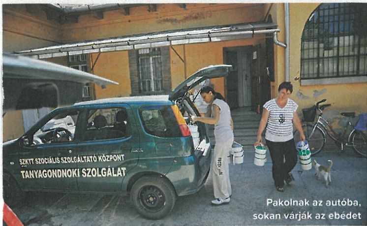
Pakolnak az autóba, sokan várják az ebédet