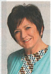
ÁRVAI MAGDOLNA RIPORTJA

Magány. Veszély. Természet. Nyugalom. Boldogság. Romhalmaz. Elvonulás. Sötétség. Bezártság. Béke. Bujdosás. Önfenntartás. Divathóbort. Ezekkel a szavakkal a tarso-